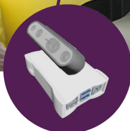
Boîtier de détection de chutes, sorties de lit et intrusion

Communication instantanée des événements dans TITANLINK