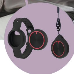
Médaille d'appel résident

DÉTECTION • SÉCURITÉ • TRAÇABILITÉ • PRÉVENTION